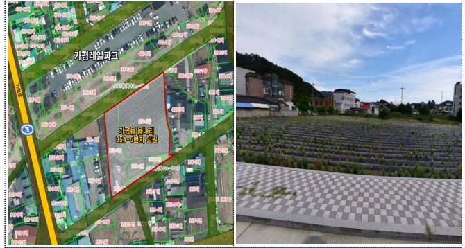
가평읍 레일바이크 인근