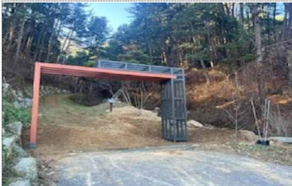
축령산 생태관광마을 둘레길 진입로