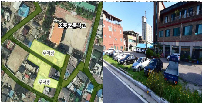
조종면 시가지(조종초교 앞)