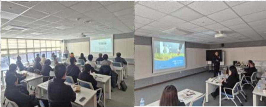
과실류 수출시장 이론 교육 및 2차 가공품 생산·수출 전략 교육