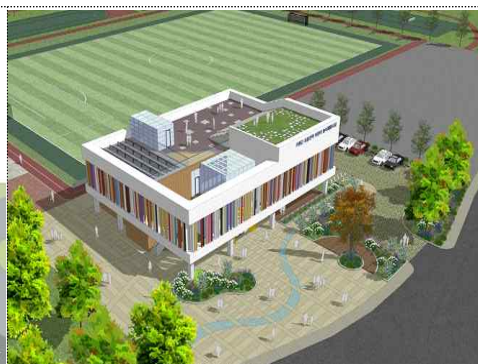
조감도(조종권역 어린이 놀이체험시설)