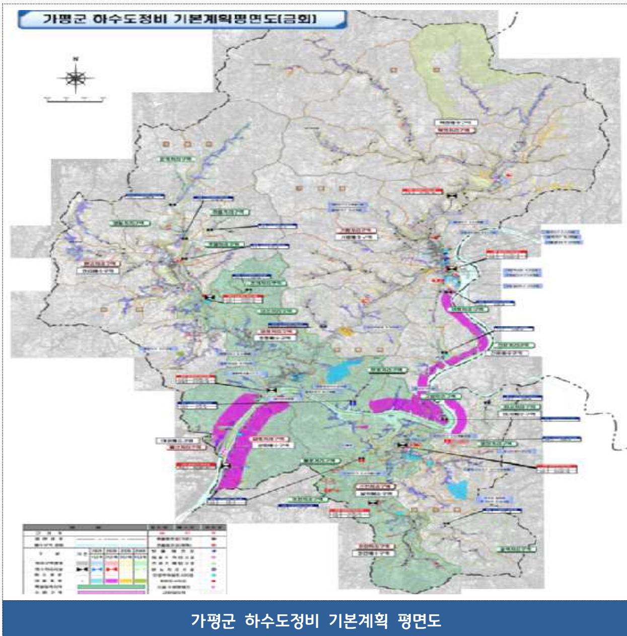
가평군 하수도정비 기본계획 평면도