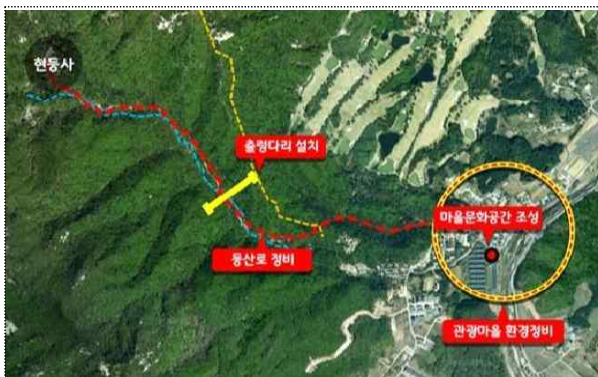
운악산 관광레저 단지 조성 위치도