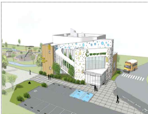
조감도(청평권역 어린이 놀이체험시설)