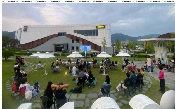
음악역1939 피크닉 콘서트