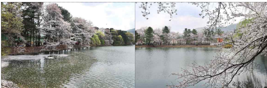
청평 중앙내수면연구소 이전부지 개방