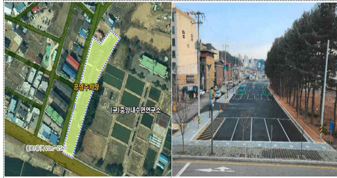
청평면 2구역(중앙내수면연구소 옆)