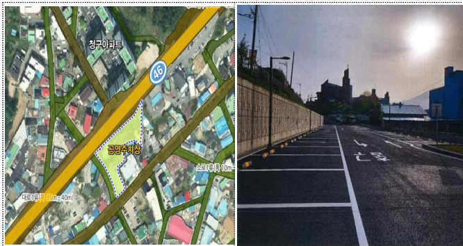
청평면 1구역(청평농협 뒤)