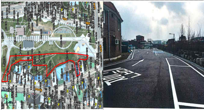
가평읍 어린이음악놀이터 옆