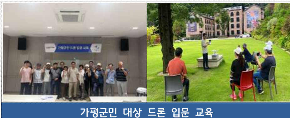
가평군민 대상 드론 입문 교육