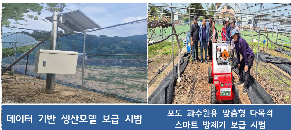
데이터 기반 생산모델 보급 시범