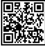
방문 희망 업체 신청