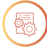
사업자등록증 및 기타 서류 제출