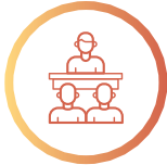
일자리센터 방문 혹은 전화